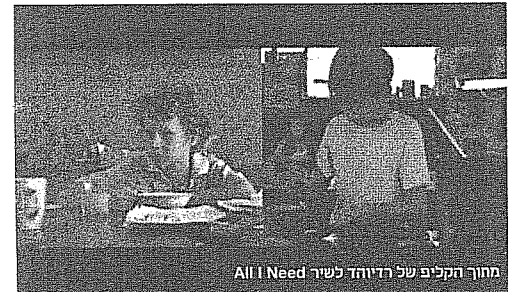
מחוקר הקליפ של רדיוהד לשיר All I Need