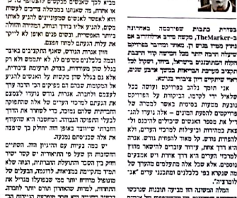
האגרות הגודש מענישות את החלשים ופוגעות ביעילות הערים.

תחבורה אבי שמחון האגרות הגודש מענישות את החלשים ופוגעות ביעילות הערים. הבעיה היא שישנן חברות בישראל שרוצות לייבא פלדה זולה. היבוא של פלדה זולה הוא תוצאה של תהליך שנקרא "התחלת היבוא של פלדה זולה". תהליך זה נמשך במשך שנים רבות, והוא נמשך גם כיום. תהליך זה נמשך בגלל העובדה שישנן חברות בישראל שרוצות לייבא פלדה זולה.