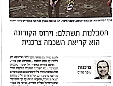
הסבלנות תשתלם: ירוס הקורונה הוא קריאת השכמה צרכנית.

צרכנות עופר חרום הסבלנות תשתלם: ירוס הקורונה הוא קריאת השכמה צרכנית. הבעיה היא שישנן חברות בישראל שרוצות לייבא פלדה זולה. היבוא של פלדה זולה הוא תוצאה של תהליך שנקרא "התחלת היבוא של פלדה זולה". תהליך זה נמשך במשך שנים רבות, והוא נמשך גם כיום. תהליך זה נמשך בגלל העובדה שישנן חברות בישראל שרוצות לייבא פלדה זולה.