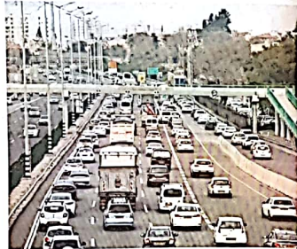
עקב כניסת כ-100 משאיות ללא מוצא מדי יום, נוצר עומס רב על כבישי המדינה.

מספר המשאיות שנסעו ללא מוצא במשך השנה האחרונה הוא כ-100. מספר זה הוא גבוה בהרבה מזה של שנים קודמות. הסיבה לכך היא העובדה שישנן חברות בישראל שרוצות לייבא פלדה זולה. היבוא של פלדה זולה הוא תוצאה של תהליך שנקרא "התחלת היבוא של פלדה זולה". תהליך זה נמשך במשך שנים רבות, והוא נמשך גם כיום. תהליך זה נמשך בגלל העובדה שישנן חברות בישראל שרוצות לייבא פלדה זולה.